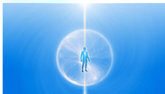
Een schone Persoonlijke Ruimte