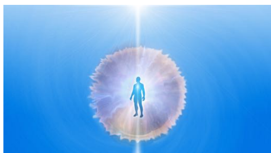
Een vervuilde Persoonlijke Ruimte

Verstoring van je fysieke blauwdruk kan ontstaan door emotionele en mentale blokkades, omgevingsfactoren zoals voeding, straling en vervuiling enz. Dit soort verstoringen kunnen zich geleidelijk vormen tot blokkerende clusters van lage trilling in je fysieke lichaam. Hierdoor raakt de natuurlijk lichaamsflow verstoord en ontstaan chronische en/of acute klachten.